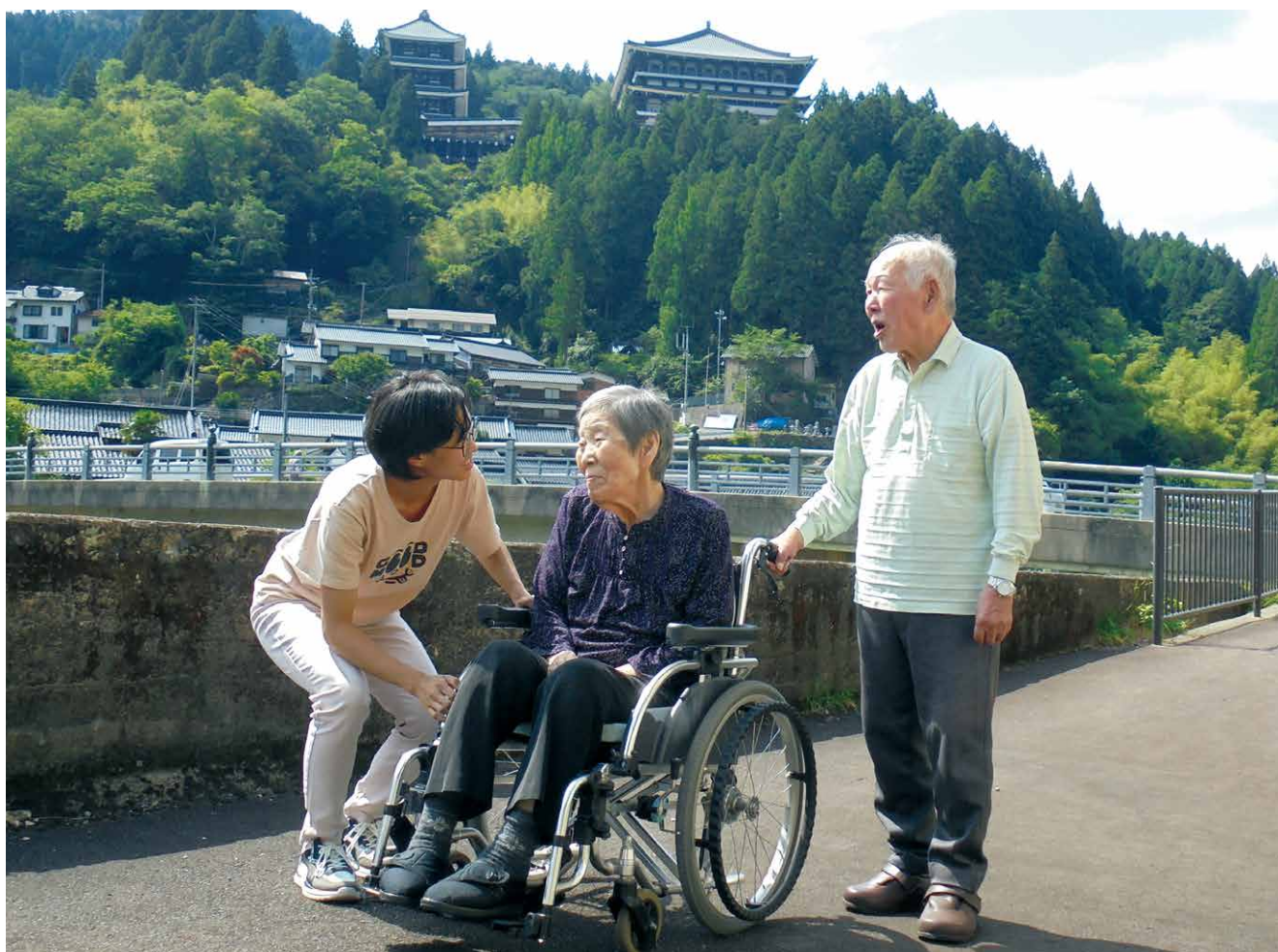
(於:グループホームむらおかの空 朝の散歩にて)