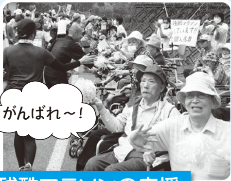
残酷マラソンの応援