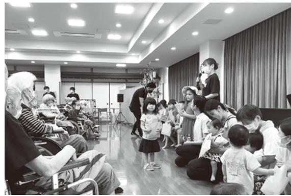
子育て・子育て支援センター